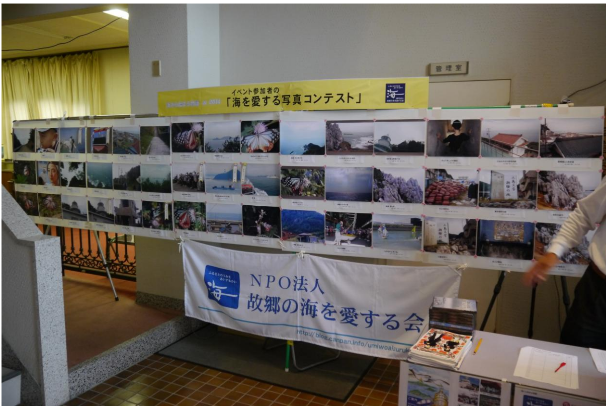
子供達の写真コンテスト