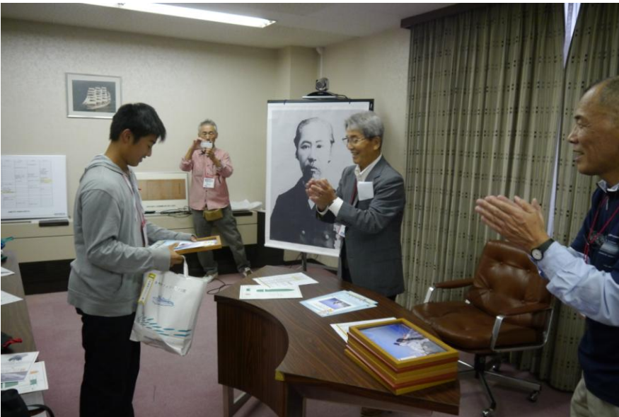
写真コンテスト 表彰式

始めの挨拶の後、水野先生の「近藤真琴」の話がありました。 その後、近藤真琴記念碑に移動し、集合写真を撮り、記念碑の説明を全員が受けました。 お昼は商船高専の学生たちの模擬店で子供達が夫々好みの物を購入して楽しみました。 午後は商船高専の学科紹介を順次見て・触って・体験しました。 最後には子供達の写真コンテストの表彰式を行いました。 コンテスト参加者 16 名。7 点の写真が選ばれ、それぞれが表彰され賞品を受け取りました。