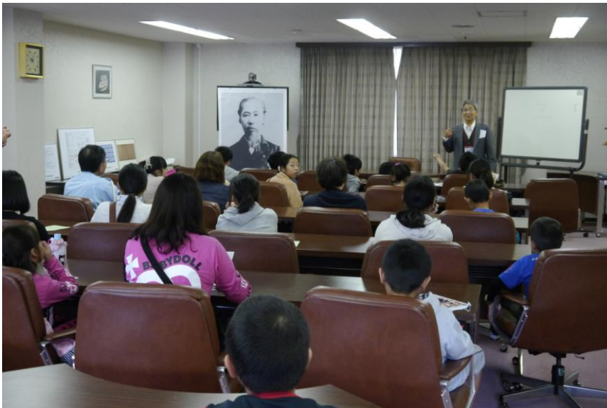
10:00 集合後、始めの挨拶

2014年11月2日、母校の海学祭に合わせ、故郷の海を愛する会の活動その④が小中学生24名と保護者、並びに主催者12名が参加して実施されました。その様子を以下に紹介します。