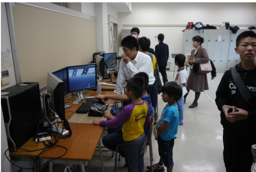
学科紹介 操船体験？